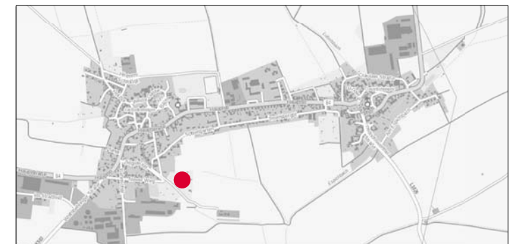
Lage im Gemeindegebiet (Übersichtskarte ohne Maßstab)

----- Räumlicher Geltungsbereich der 1. Änderung des Bebauungsplanes — Ursprungsbebauungsplan "Am Sottengarten"